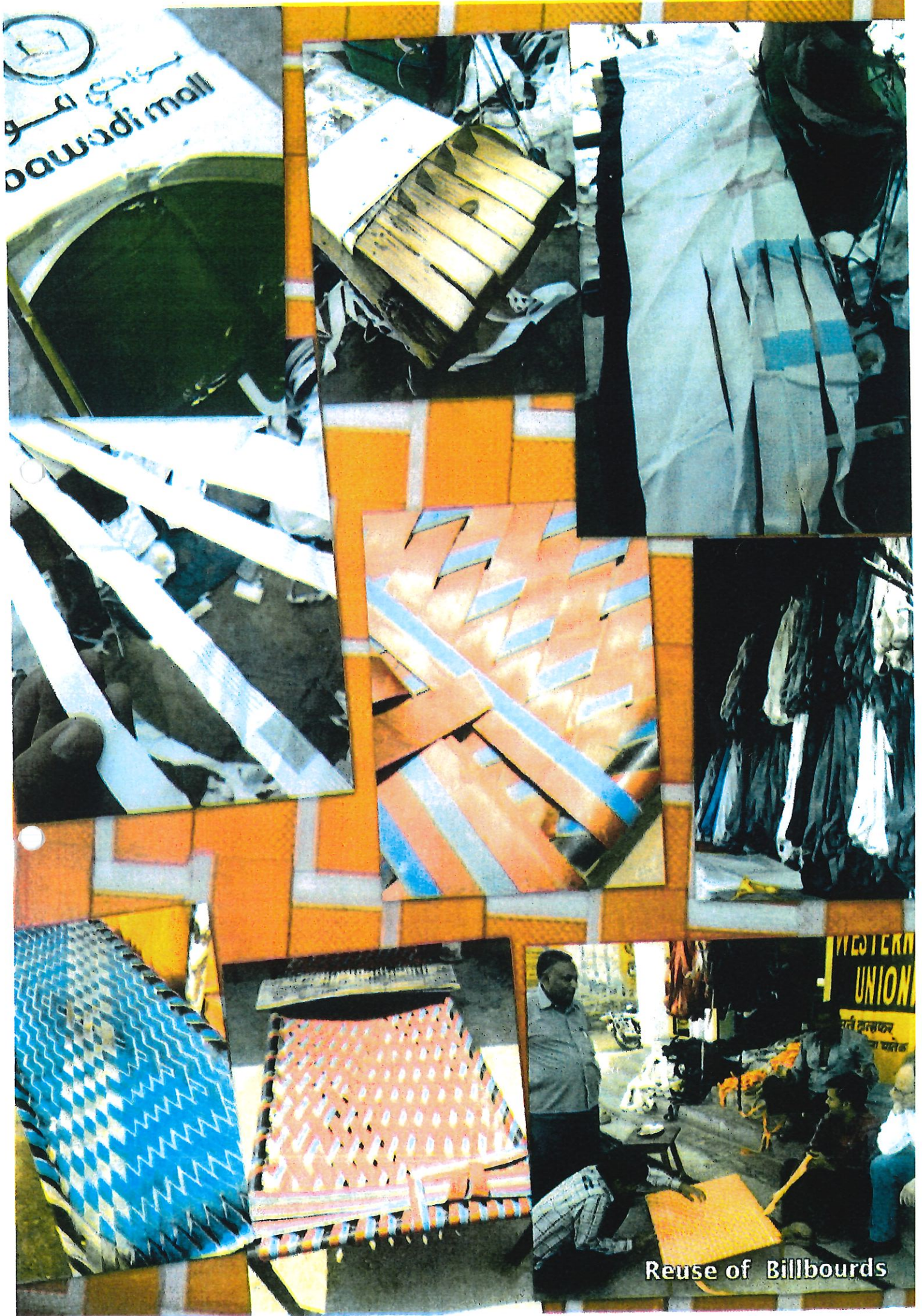
Reuse of Billboards