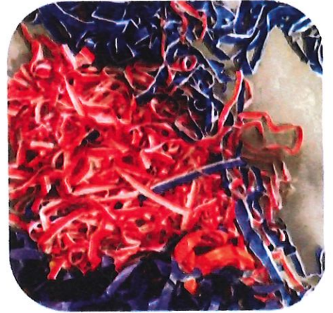
BP30 PVC Tarpoline trimmings